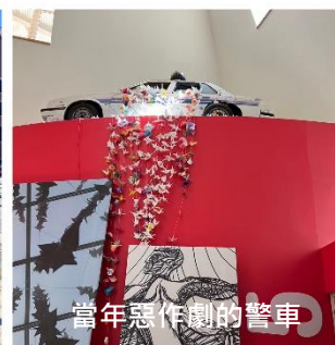
當年惡作劇的警車