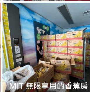
MIT 無限享用的香蕉房

1991 年被一群瘋狂的 MIT 學生化為了現實，成功地將消防栓和飲水機結合，自此成了校園內著名的景觀之一。當我們步行遠過餐廳後，映入眼簾的，赫然是一輛高置於牆上的警車，原來這是 1994 年時，一群瘋狂的學生，高仿了一輛警車，將其擺放於著名的 The Great Dome 頂端，此後 911