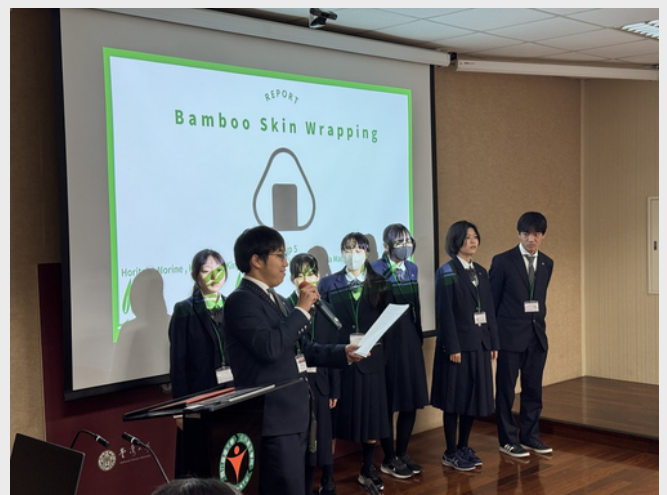
圖、高槻高中學生專題研究報告