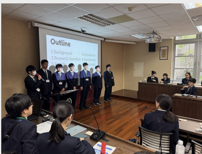
圖、高槻高中學生專題研究報告