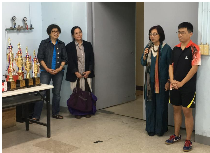
圖三：李明暉教授蒞臨並致謝辭