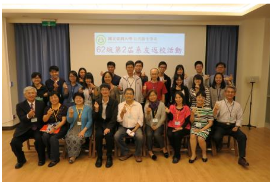
圖說：2017 公衛系第 2 屆系友回娘家

四、本校辦理校友畢業 40 年回娘家，公衛系 5 位該屆系友(B62 級)返院，並與 20 位師生參與座談。