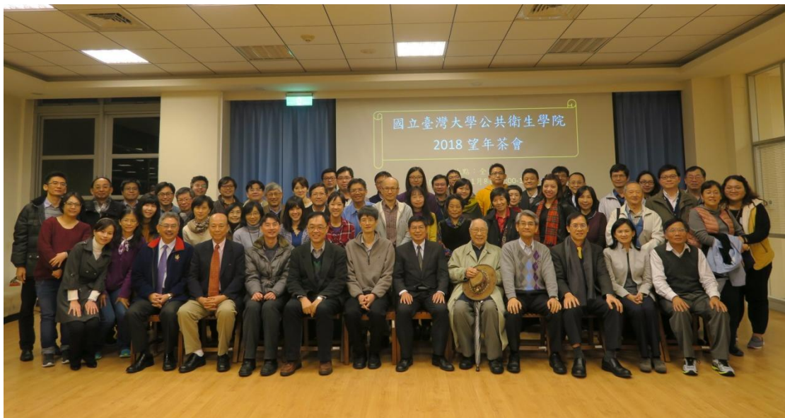
圖說：2018 公衛學院期末工作檢討會暨望年會合影