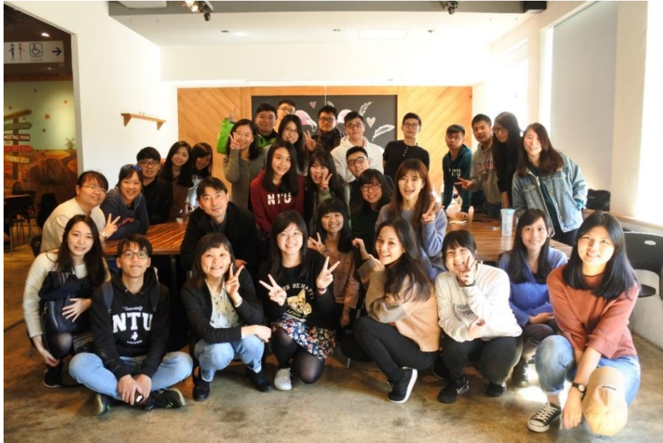
圖說：環衛所暨食安所聯合所遊在「鄰居家動手做工作室 Pizza&義大利麵手做體驗」合影

五、研究所新生踏入新的研究領域，對於如何選課、研究，難免有些疑惑與徬徨。為促進師生交流，1月14日環衛所暨食安所聯合安排一日所遊，共計有31位環衛所及食安所兩所師生參與。活動內容有「Pizza&義大利麵手做體驗」、「桃園大溪老街」一遊及「石門水庫」健行活動。學生對於所上師生也有更多認識。