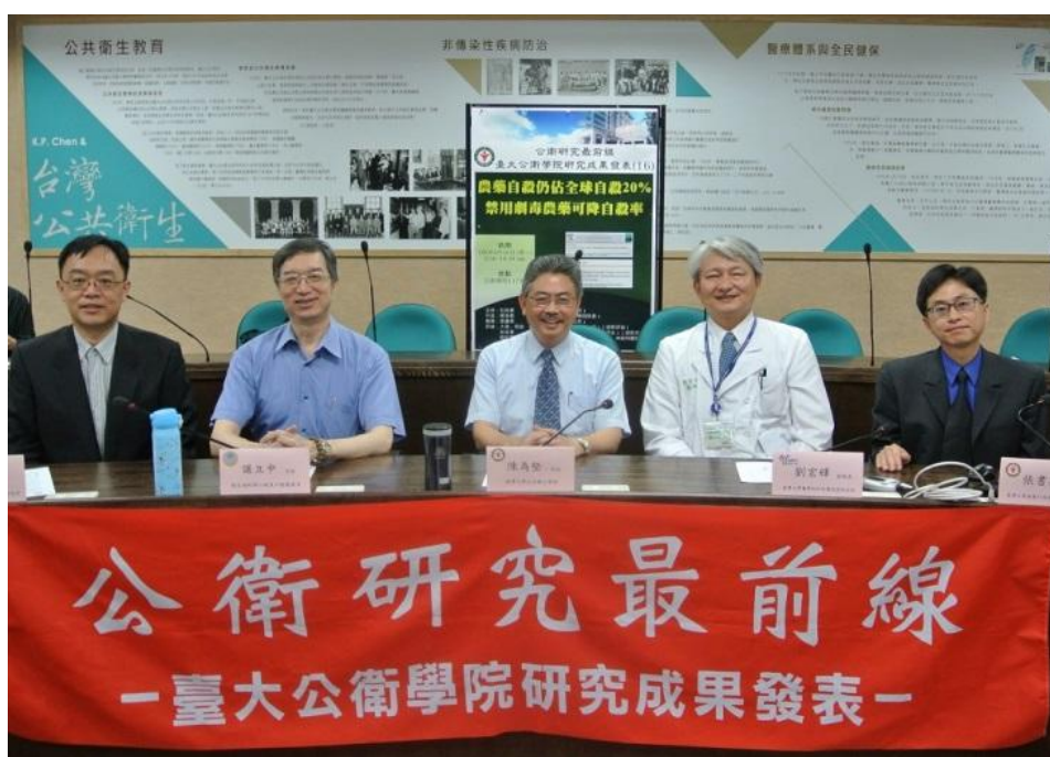
圖說：於臺大公共學院發表預防農藥自殺研究成果（2017）

之後，農藥自殺率顯著降低，整體自殺率也同步下降，其它方法的自殺率也沒有增加。韓國資料的研究成果被世界衛生組織 2017 年世界衛生統計年報所引用，作為減少國家自殺率而朝向永續發展目標（Sustainable Development Goals）的範例。衛福部心口司在推動禁用巴拉刈時，亦有引用我們的研究成果。在各界呼籲下，農委會去年(2017)十月正式宣布，將於 2018-2019 年全面禁用市面上含巴拉刈的農藥。