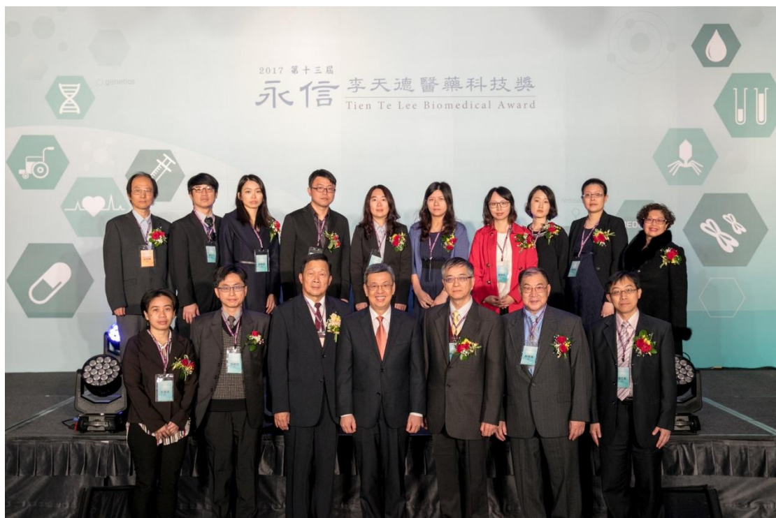
圖說：與陳建仁副總統、永信李天德醫藥基金會李芳裕董事長，與所有得獎人合照

感謝這次有幸獲頒第 13 屆永信李天德醫藥科技獎「青年醫藥科技獎」。在此首先簡介我們團隊獲獎的研究成果，之後感謝有助研究的相關人士。