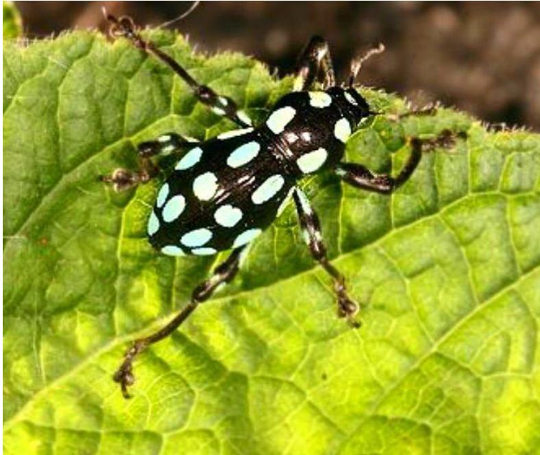
圖說：小圓斑球貝象鼻蟲

椰子蟹是很有攻擊性的生物，雖然很可愛但在觀察牠的時候一定要格外小心，目前在台灣本島上已經很難發現椰子蟹的蹤影了，在蘭嶼椰子蟹是很重要的觀光資產，因為是保育類生物，捕捉和食用都是被禁止的。