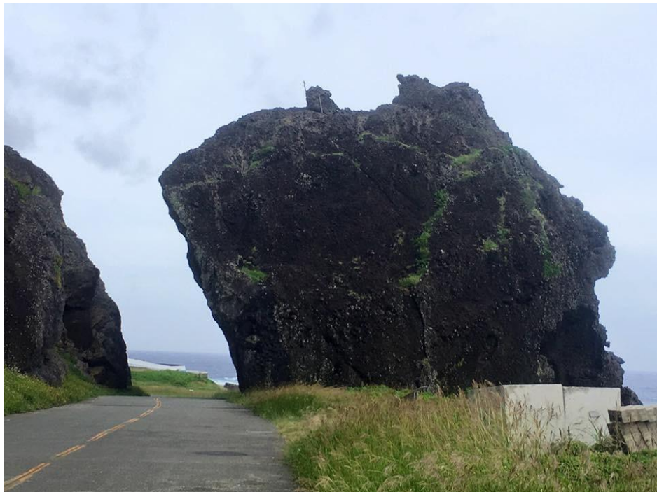
圖說：紅頭部落是蘭嶼受漢族文化影響最深的村落，也是蘭嶼唯一一間郵局的所在地，旅途中不妨寄張明信片給自己，紀錄美好的回憶與感受。