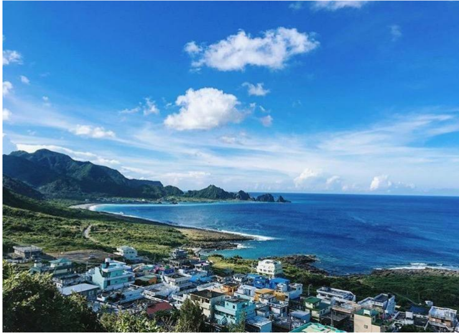
圖說：野銀部落是蘭嶼最適合眺望海景的部落，此起彼落的房屋顏色五彩繽紛，一幢幢在大海的襯托下，非常小巧可愛。