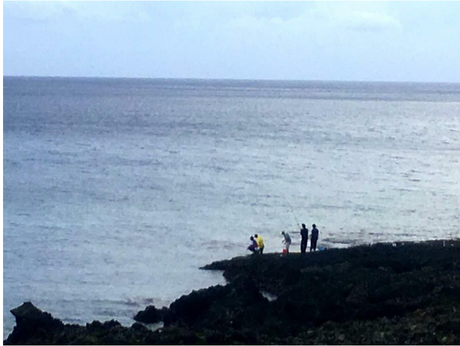
圖說：朗島部落是蘭嶼地下屋最多且最原始的村落，也是蘭嶼勇士舞的發源地，擁有廣大的潮間帶。