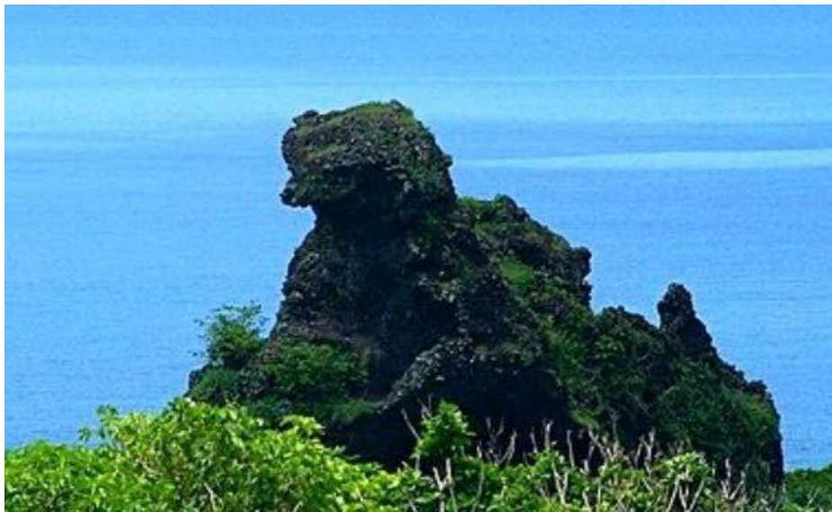
圖說：東清部落是最能體現達悟族傳統文化的村落，著名的拼板舟體驗也是東清部落享有盛名的活動，更是許多遊客選擇拍攝日出的地方。