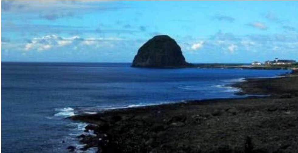
圖說：漁人部落是蘭嶼島上地勢相對較平緩的地區， 所以蘭嶼機場與電廠皆蓋在此村落。

從椰油部落出發往北邊環島一圈，騎車約九十分鐘可以完成環島之旅，途中會看到許多自然景觀和沿海隆起的珊瑚礁，其中以紅頭岩、玉女岩、五孔洞、青青草原、饅頭岩、及軍艦岩最負盛名，這些岩石真的讓人感受到大自然神奇的力量。傍晚時分夕陽映在饅頭岩上紅通通一片，更是會讓旅客停下腳步，相機快門拍不停的美麗風光。雖然蘭嶼的面積小小的，當地人口又以達悟族人居多，然而島上六個部落還是有各自的特色，騎車途中依山傍海，成群的山羊在街邊吃草，能踏上這樣一塊土地，人生夫復何求！