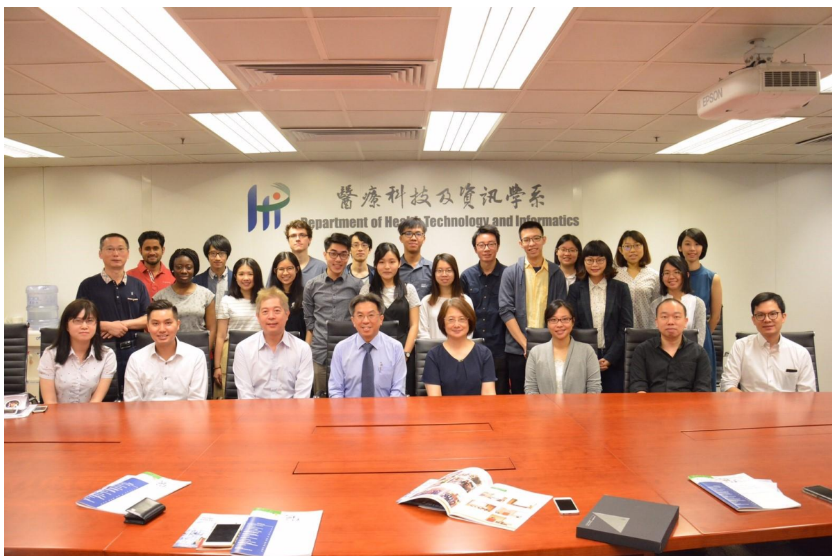
圖說：於香港理工大學醫療科技及資訊學系會議室合影

前往香港前的第一站：行前會議，所謂知己知彼，百戰百勝。鄉巴佬如我，完全不知道一個完整的參訪過程到底是如何進行的，我原本以為只要人過去然後像是觀光團一樣去看各個要參訪的單位，但是老師傳來的訊息告訴我事情沒那麼單純，「我們目前預計會參訪的香港威爾斯親王醫院、卓健醫療集團，請你針對這兩個地方做個簡單介紹喔！還有交流的時候會需要用英文介紹臺大。」其實當下還是不太能理解在參訪前先了解的用意，直到我開始著手做投影片時，在一邊搜尋的過程，一邊比較臺灣的醫學單位，更可以對於我們所要參訪的內容有精確的定位。參觀一個單位，不應該只是單方面的從該單位吸收資訊，主動去搜尋相關的資訊，更可以幫助我們有效了解，並深入想參訪的部分。