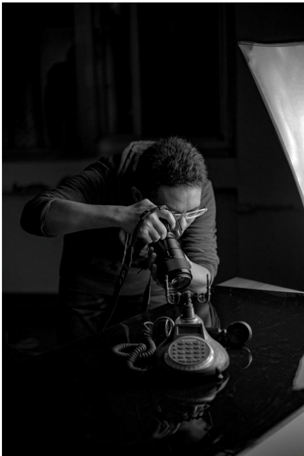
圖說：陳彥豪同學攝