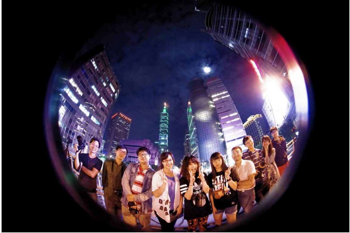
圖說：攝影社同學活動作品