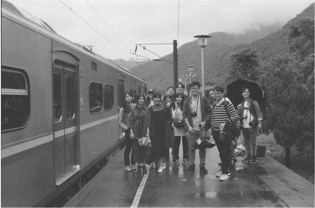
圖說：陳秀博同學攝