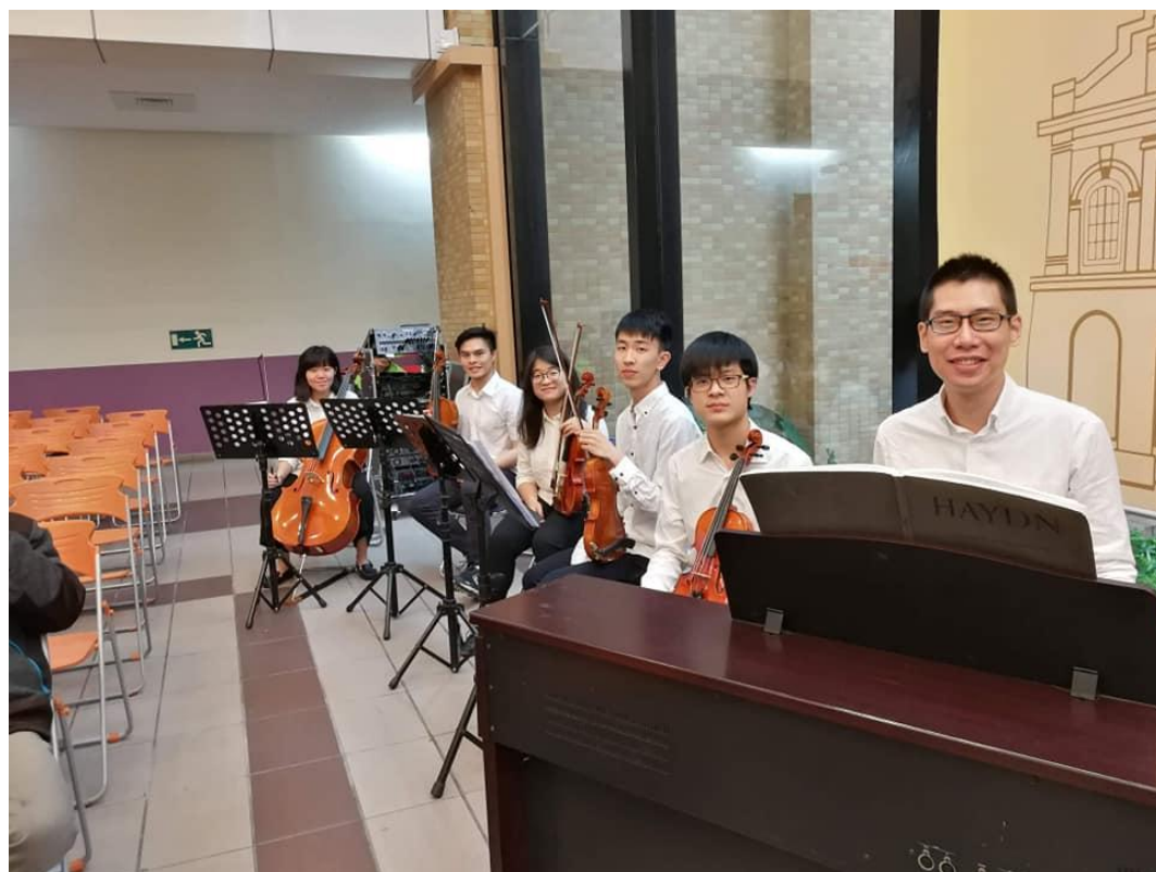
圖說：醫學院慰靈公祭的演出