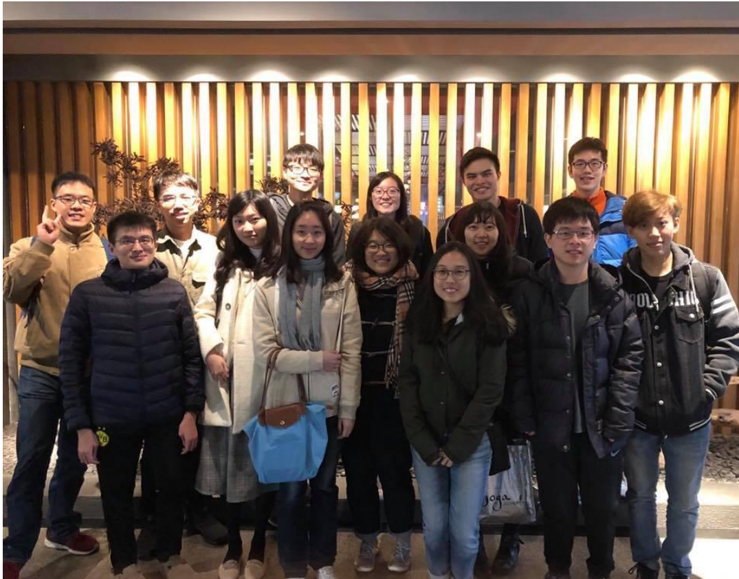
圖說：杏林管弦社聚