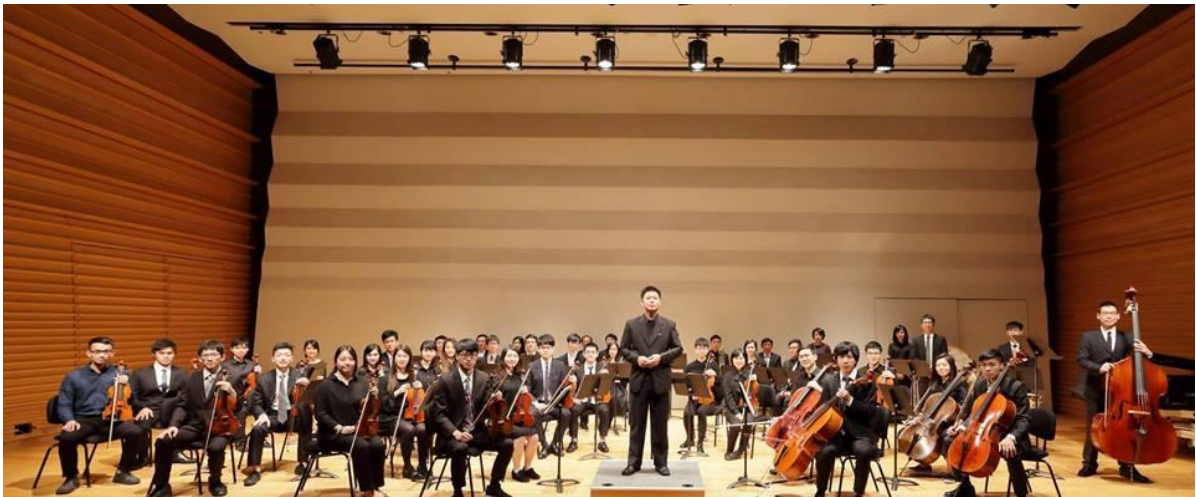
圖說：杏林管弦樂團每年在松菸誠品的演出

如對杏林管弦樂團有興趣或有任何疑問，歡迎向社長或是我們的臉書粉絲專頁「杏林管弦樂團 Hsin-Lin Chamber Orchestra」詢問，我們將盡快回復您。