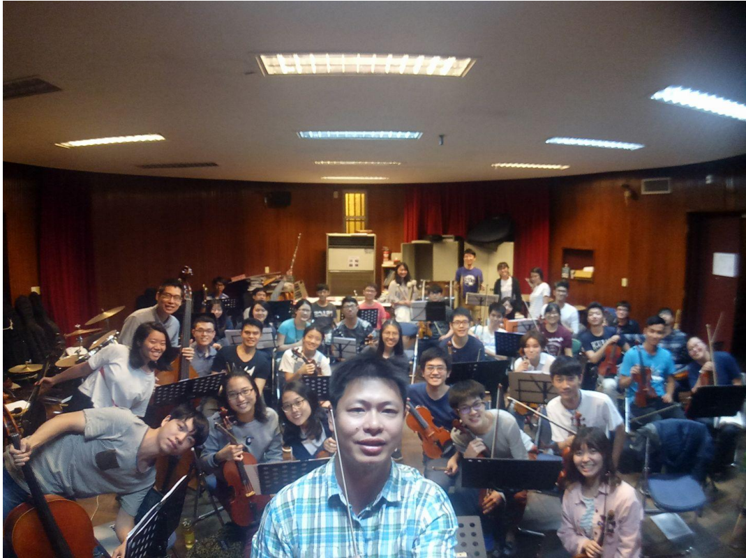
圖說：每個禮拜在圓形小劇場的練習