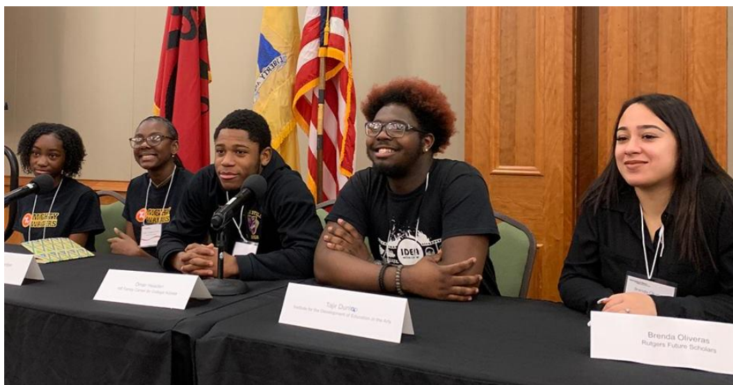
圖說：與談的 Rutgers Future Scholars Camden 青年

除了學術上的論文交流，本次會議最彌足珍貴的部分，是在學術研討會上邀請青年與會現身說法，童年研究強調納入兒童與青年的聲音，本次會議身體力行邀請青年進行多場座談與分享，以下分享一場青年座談-HOPE WORKS (希望工程)