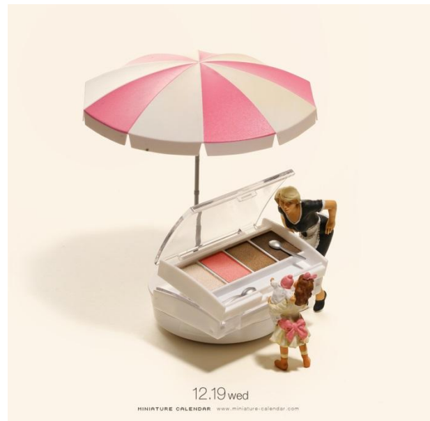
“Eye-ce Cream” 要什麼口味的冰淇淋？