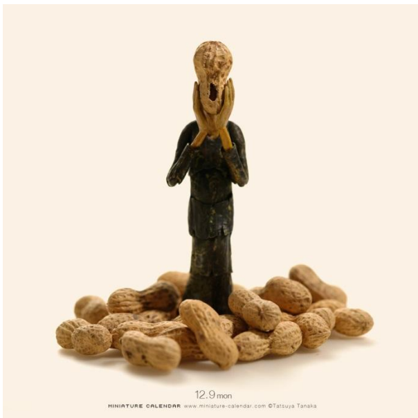
“The Scream” (吶喊)又是星期一