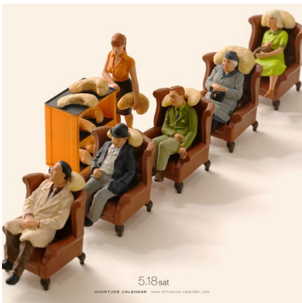
“Travel Nuts Pillow”