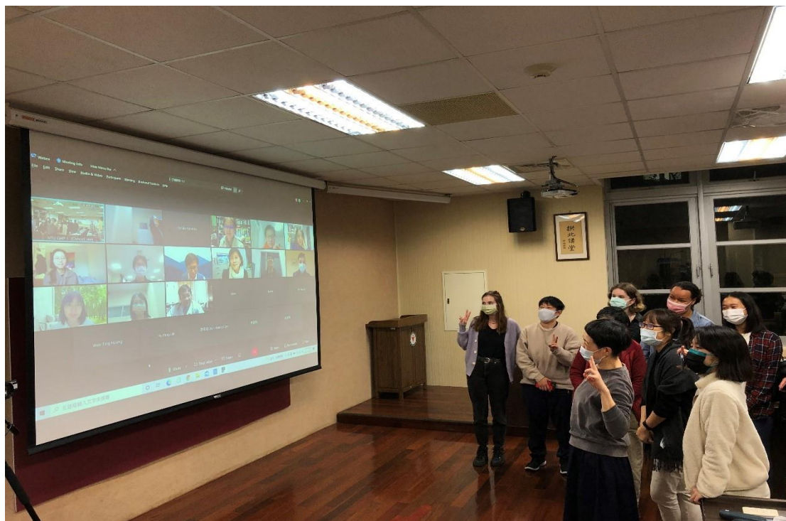
▲講座圓滿落幕，現場參與者們齊聚螢幕前的全體大合照