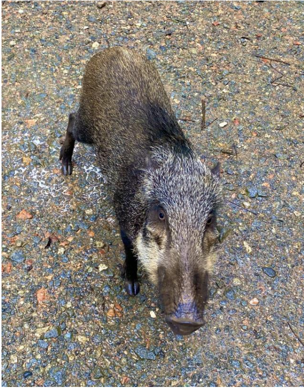
圖十四:Pulau Ubin 的山豬