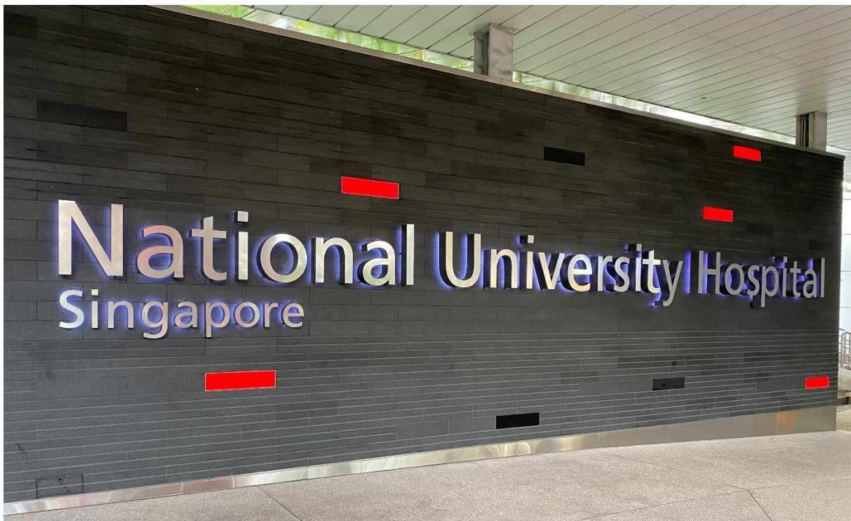
圖一：NUH 新加坡國立大學醫院 血液科