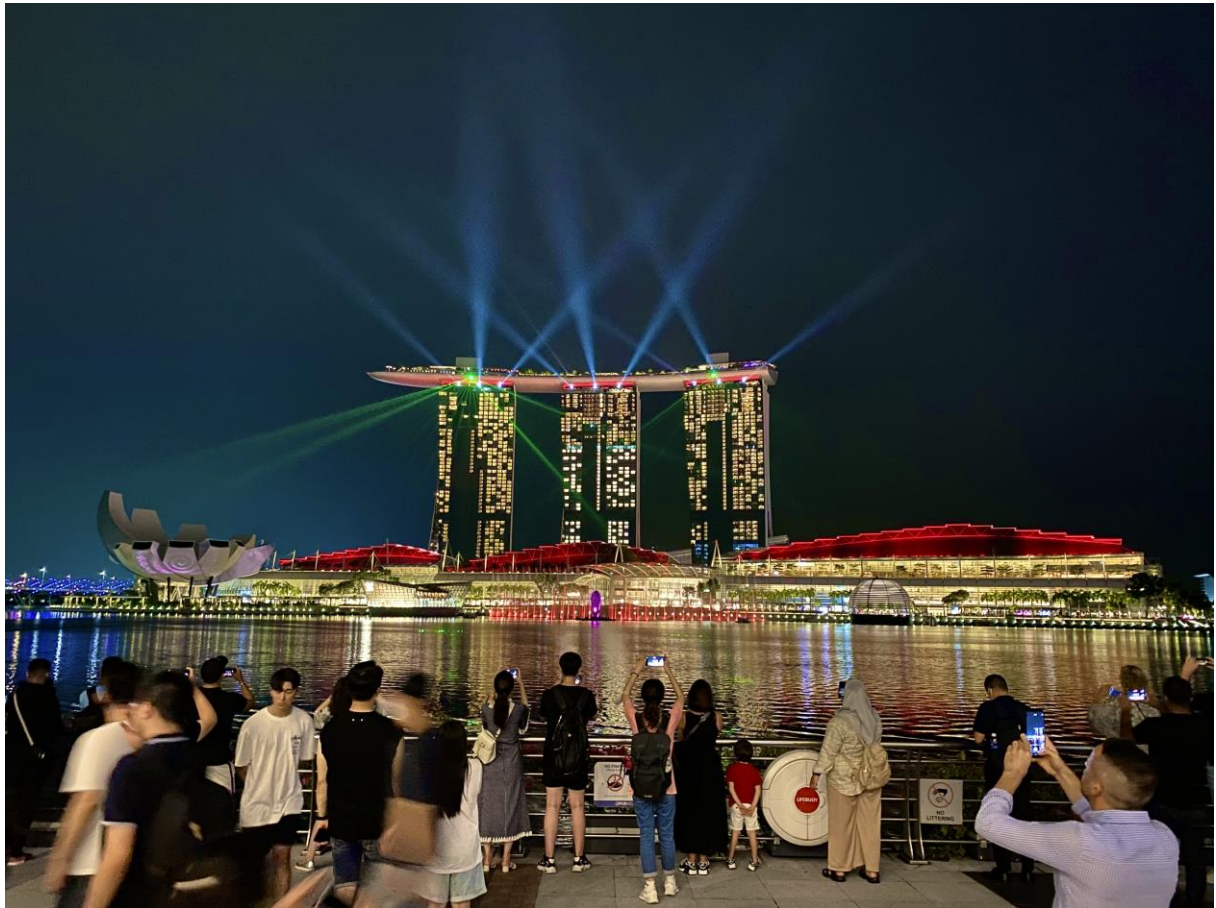
圖十三：Marina Bay 的水舞

除了非常有名的 Garden by the Bay、marina bay 水舞秀、Sentosa 海灘，我這次還去了一個比較少人知道的離島 Pulau Ubin。只要搭乘公車到 Changi Point Ferry Terminal，再搭 10 分鐘的船就可以到達。那邊是一個很原始的島嶼，島上很多山豬跟猴子，蠻特別的。