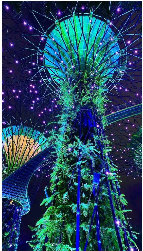
圖十五、Supertree Grove (每天晚上會有兩場燈光秀)