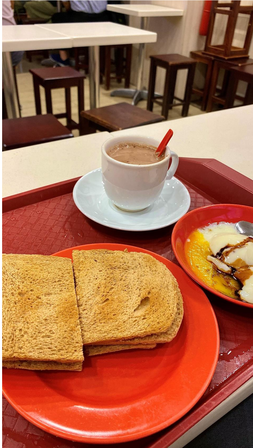
圖六：亞坤咖椰吐司

咖椰吐司配半生熟雞蛋及咖啡，是新加坡傳統的早餐。咖椰醬是用椰漿、雞蛋、砂糖和奶油做成，吐司中還會夾一塊牛油，甜而可口。而當地的咖啡，福建話叫 Kopi，又分為 Kopi（咖啡+煉乳+糖）、Kopi 0（黑咖啡+糖）、Kopi C（黑咖啡+糖+加鮮奶）。而亞坤是新加坡的連鎖咖椰吐司專賣店，他的吐司特別的酥脆，個人十分喜歡。