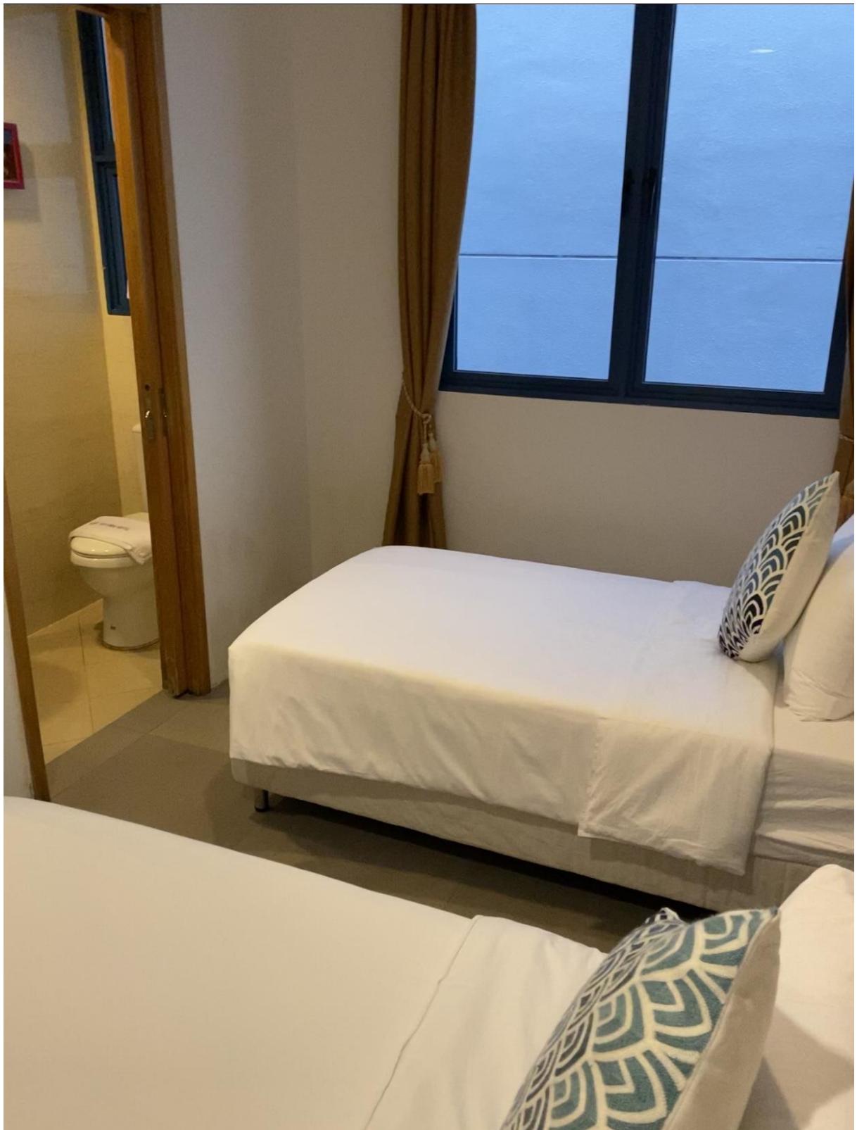
圖十二：後面幾天住比較好的旅館房間

去了有獨立衛浴的旅館。雖然一個晚上要台幣大約 2500，但應該是新加坡旅館裡面算便宜的了。