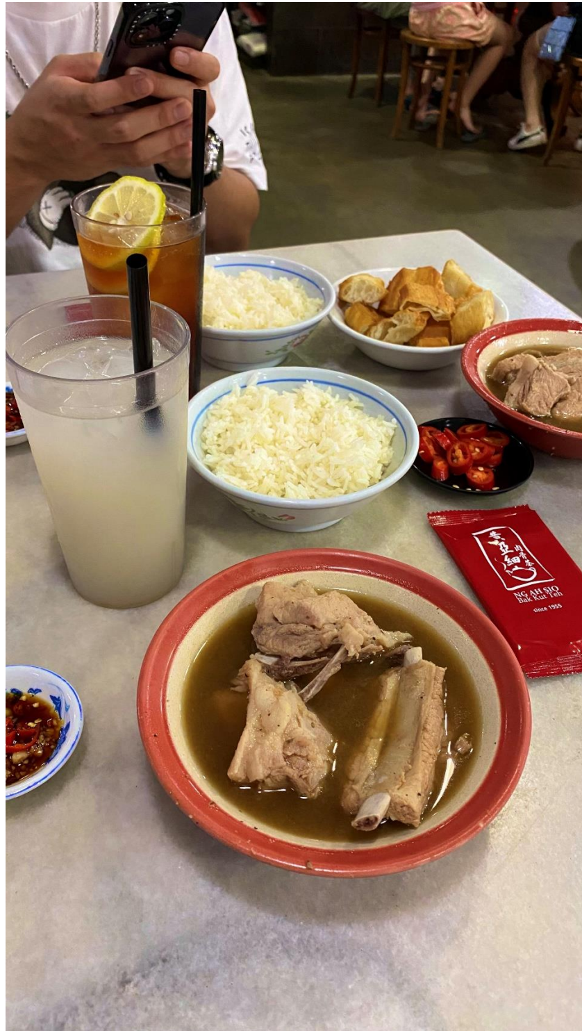
圖七：黃亞細肉骨茶

肉骨茶也是新加坡的特色湯品，又可以分為新加坡式的和馬來西亞式的，前者有比較重的香辣胡椒味，後者則比較是藥膳的味道。而黃亞細肉骨茶是我個人最喜歡的一家，但他除了香辣味十足之外，多了一層肉排香味，層次豐富。而這邊的肉骨茶都會搭配白飯和油條一起吃，酥脆的油條，吸飽肉骨茶，非常美味。