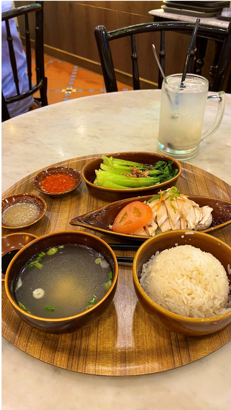
圖八：黎記海南雞飯