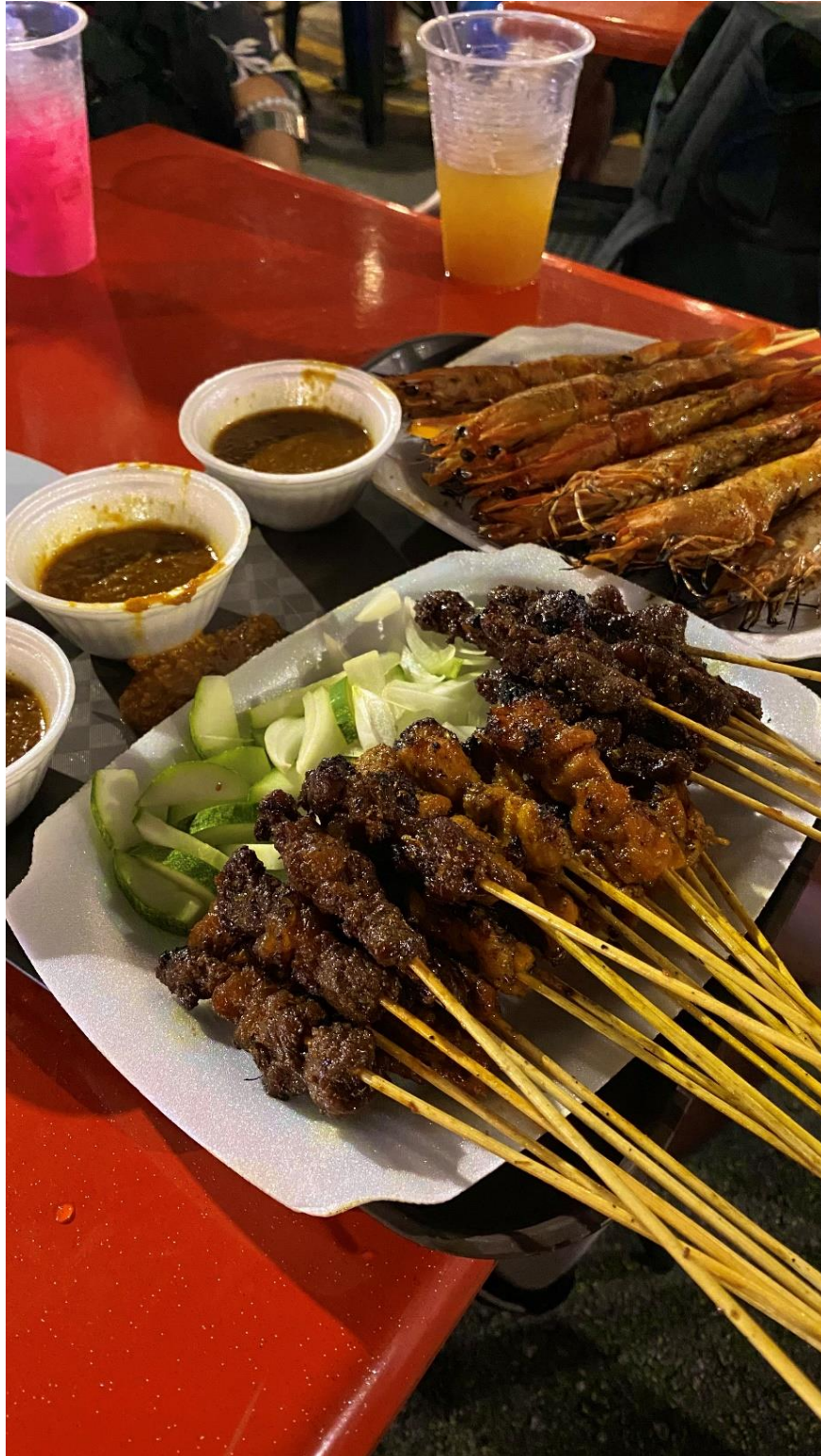
圖十：老巴剎的沙爹

老巴剎是當地非常有名的沙爹街，像是在金融區中間的夜市，整條街都是賣沙爹的，每到假日人滿為患，不管當地人還是旅客，都來這邊品嚐美味的沙爹。