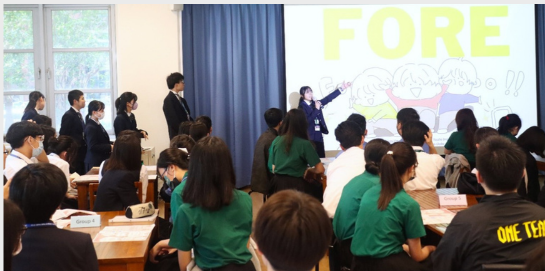
▲ 高槻高中學生第二組專題研究報告「FOR(Future Of Refugees)」。