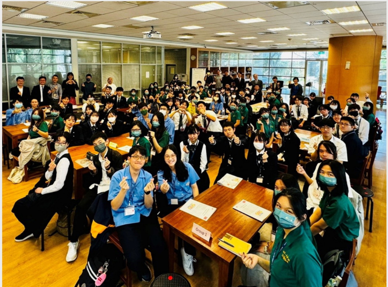
▲（上、下圖）全體人員於活動場內大合照。