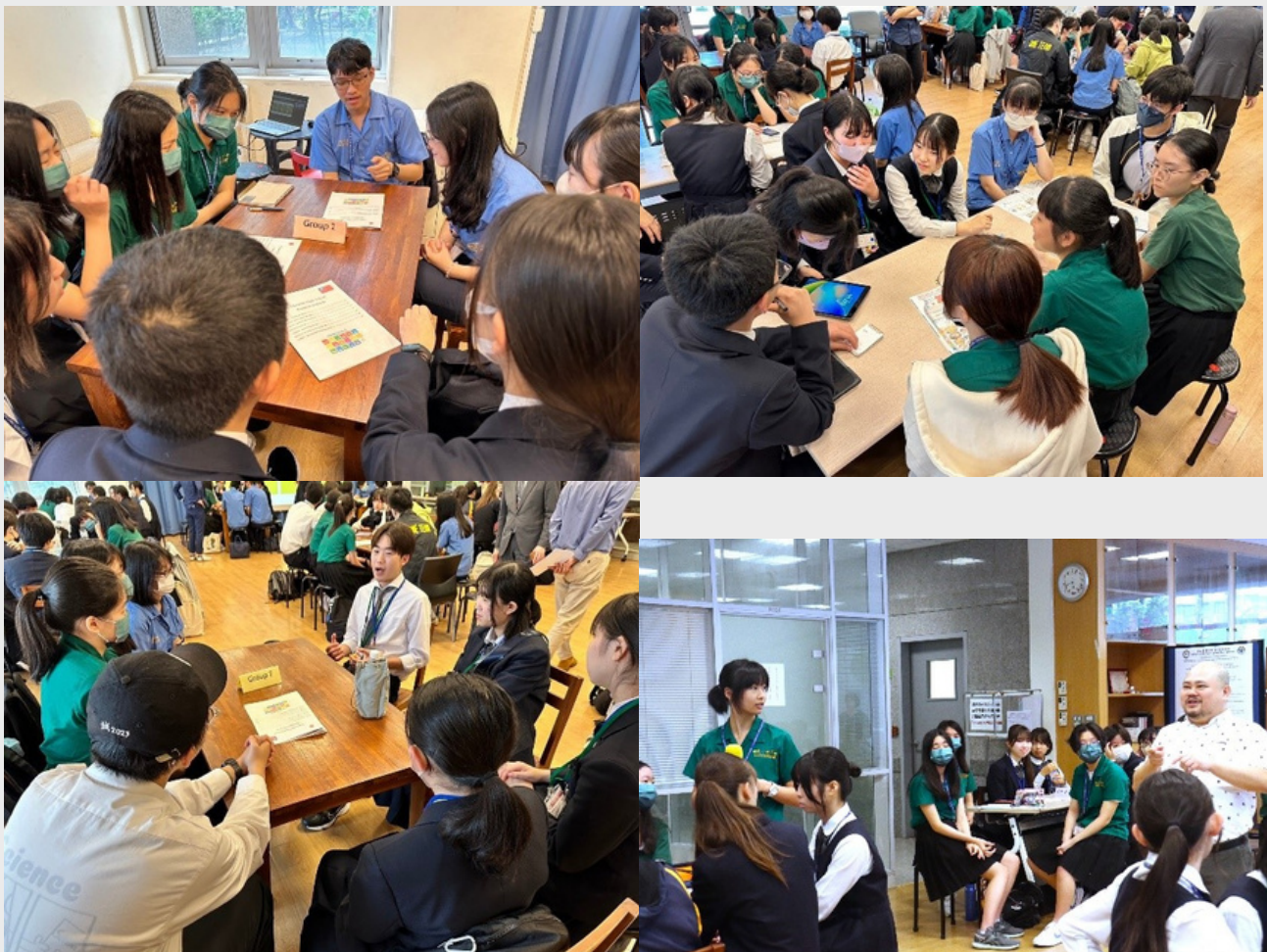
▲ 活動進行畫面，各組學生有15分鐘進行討論，接著依照組別派一名代表依序提出答覆。