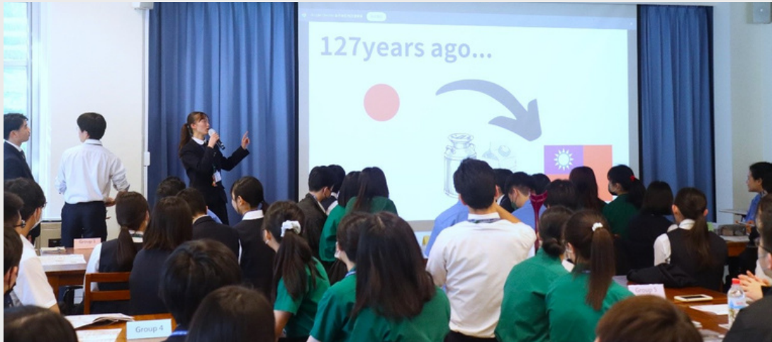
▲ 高槻高中學生第三組專題研究報告「Revival of Dairy Farmers」。