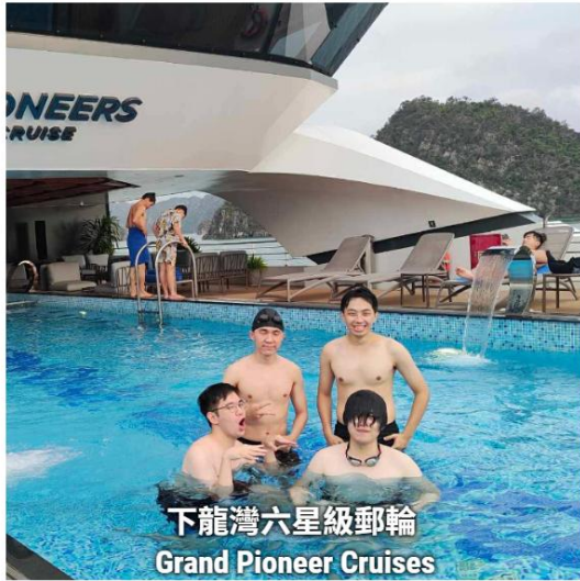
下龍灣六星級郵輪 Grand Pioneer Cruises