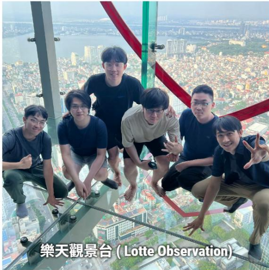
樂天觀景台 (Lotte Observation)