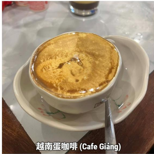
越南蛋咖啡 (Cafe Giang)