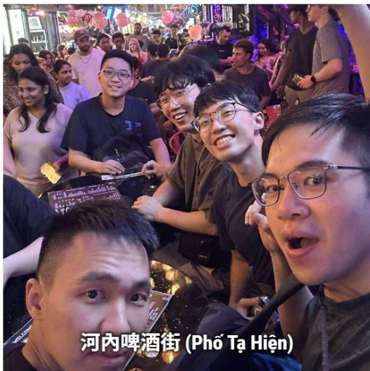
河內啤酒街 (Phố Tạ Hiện)