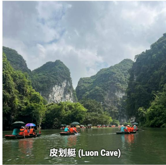
皮划艇 (Luon Cave)