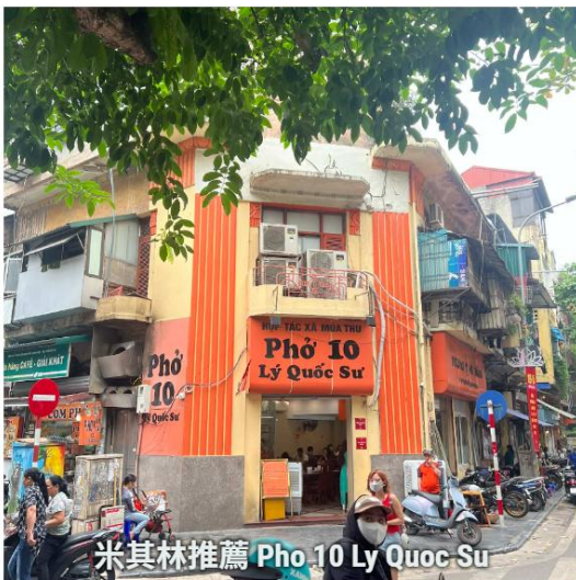
米其林推薦 Phở 10 Ly Quoc Su