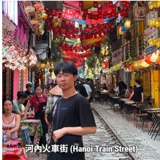
河內火車街 (Hanoi Train Street)