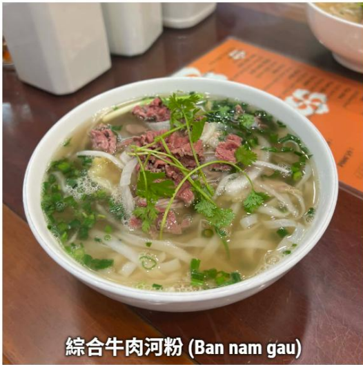
綜合牛肉河粉 (Ban nam gau)

狹窄街道如中世紀棋盤般錯落，法式殖民建築與街邊小店交織成獨特景象。穿過擁擠巷弄後，視野忽然豁然開朗——聖若瑟主教座堂（Nhà thờ Lớn Hà Nội）靜靜立於廣場中央。建於 1886 年的哥德式建築，雙塔筆挺、窗框斑駁，宛如越南版的巴黎聖母院。午後陽光灑在湖綠色木窗上，彷彿在述說百年的風霜與戰火。走入教堂，空氣立即變得清涼，帶著麥芽香與淡淡燭味，讓人瞬間從老城的喧囂中抽離。