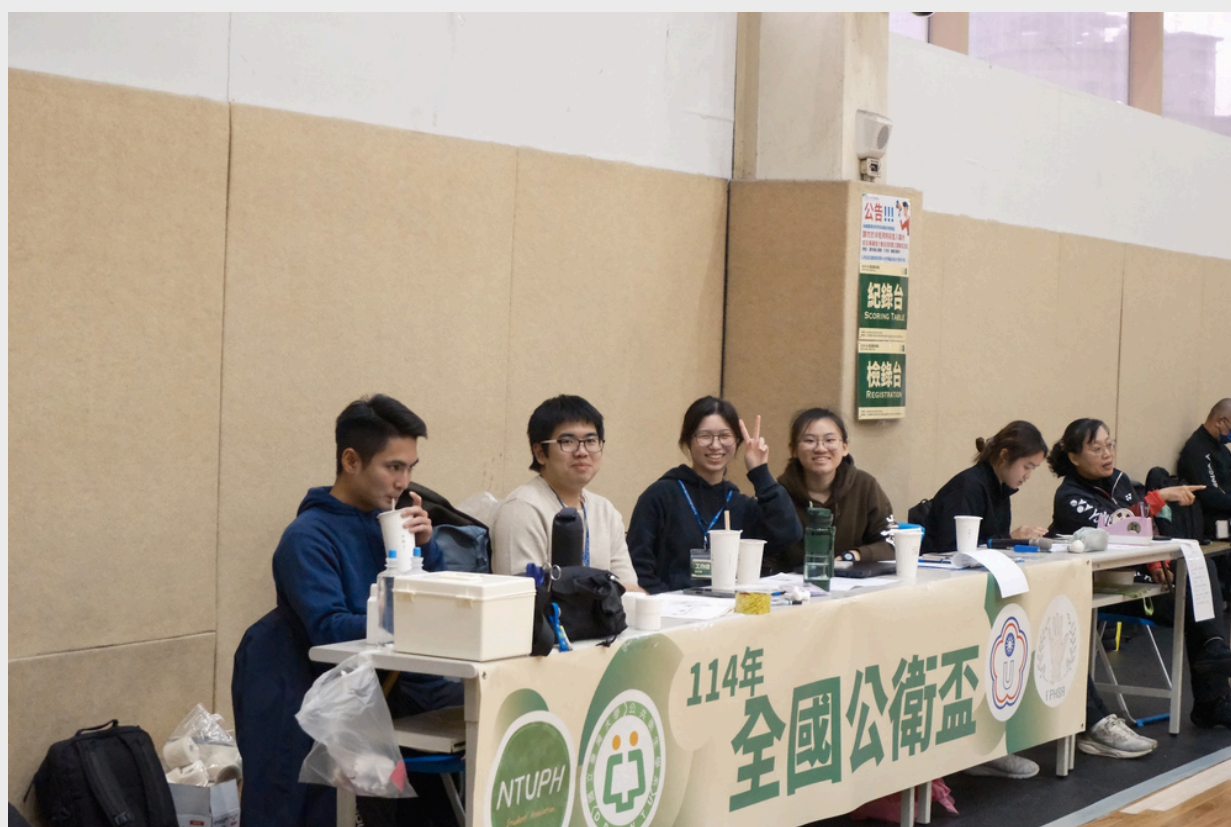
圖、羽球場地辛苦的工作人員