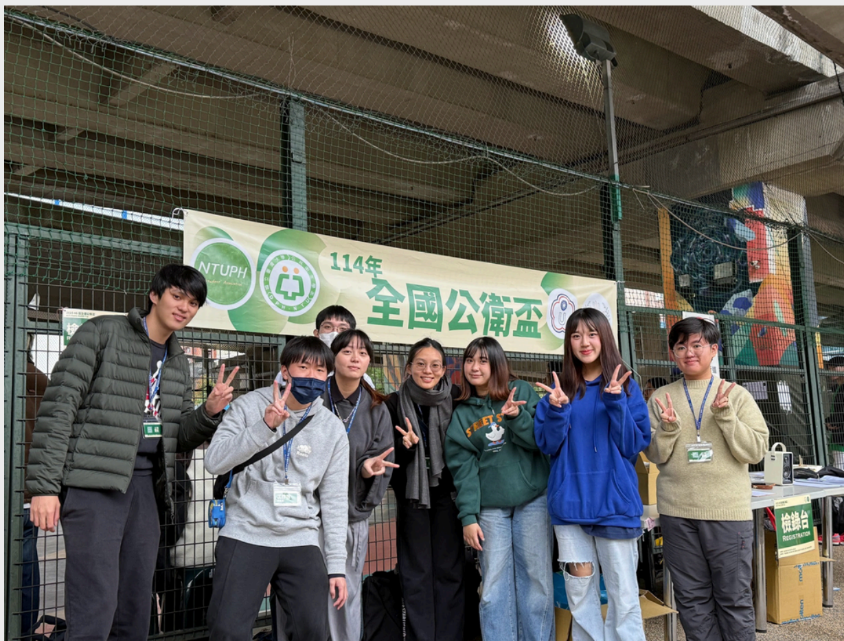
圖、籃球場地辛苦的工作人員們