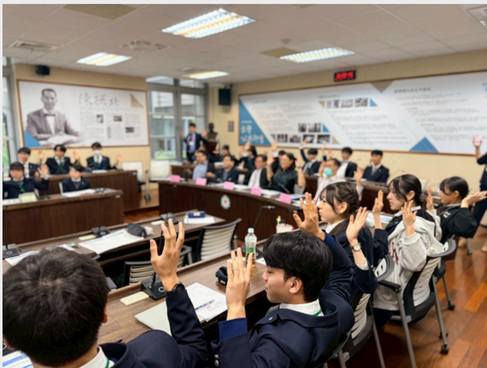
▲ 全體出席者在發表同學的帶領下，一起作起頸椎的舒緩運動。