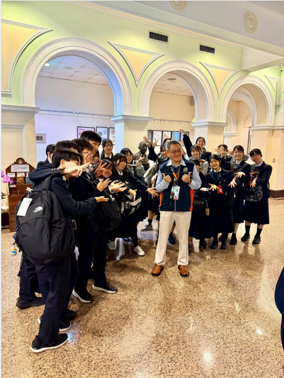
▲ 高槻高中學生主動邀請導覽員合影留念。