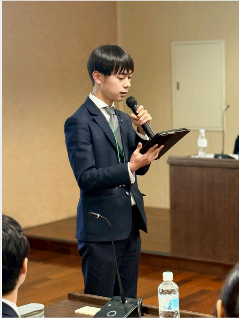
▲ 高槻高中學生代表致感謝詞。