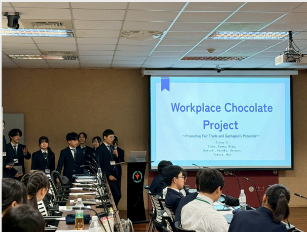
▲ 高槻高中學生第一組專題研究報告「Workplace Chocolate Project」。

第二場活動是由高槻高中選出3組學生代表依序進行專題研究成果報告，報告主題分別為：Towards a Fruitful Future ~ Pieces of Chocolate into pieces of Employment~、Workplace Chocolate Project、The Hidden Danger of Text Neck。日本學生們以英文進行的報告生動有趣，尤其是跟現代文明病環環相扣的The Hidden Danger of Text Neck。公衛學院共有5位老師應邀擔任綜合講評員，包括流行病學與預防醫學研究所張慶國與吳亞克副教授、健康政策與管理研究所郭年真與張弘潔副教授，以及環境與職業健康科學研究所林亮瑜助理教授。講評的老師們對於學生的創新想法頗感興趣，同時提出精進調整的方式並期待未來能真正落實於生活當中。