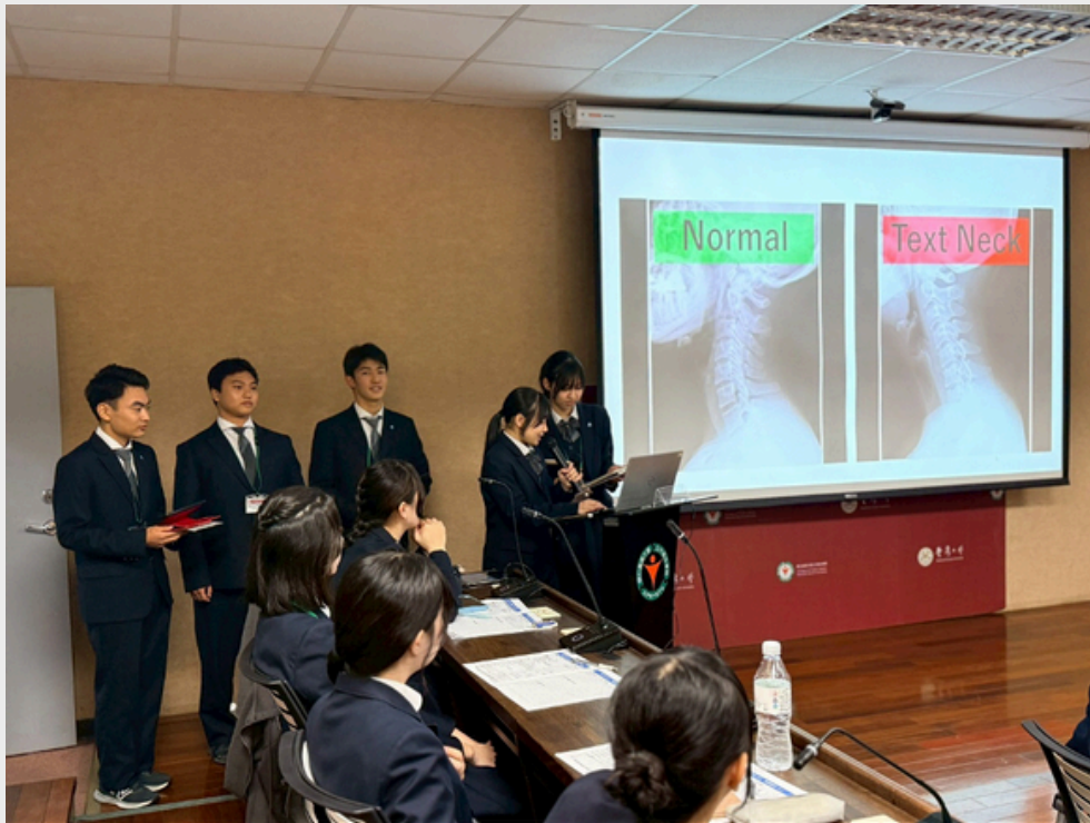
▲ 高槻高中學生第二組專題研究報告「The Hidden Danger of Text Neck」。