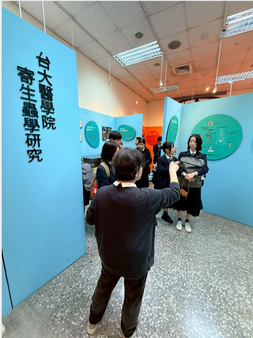
▲ 高槻高中學生正在參觀寄生蟲研究的展區。

最後一個活動，場地移至臺大醫學院人文博物館辦理。人文博物館安排兩位日文導覽員，分兩組帶領學生解說館內展覽內容以及博物館與日本的淵源。透過熟悉的母語導覽，讓日本學生們能在有限的時間內以最有效率的方式理解展區資訊，為本次的半日參訪活動畫下完美的句點。