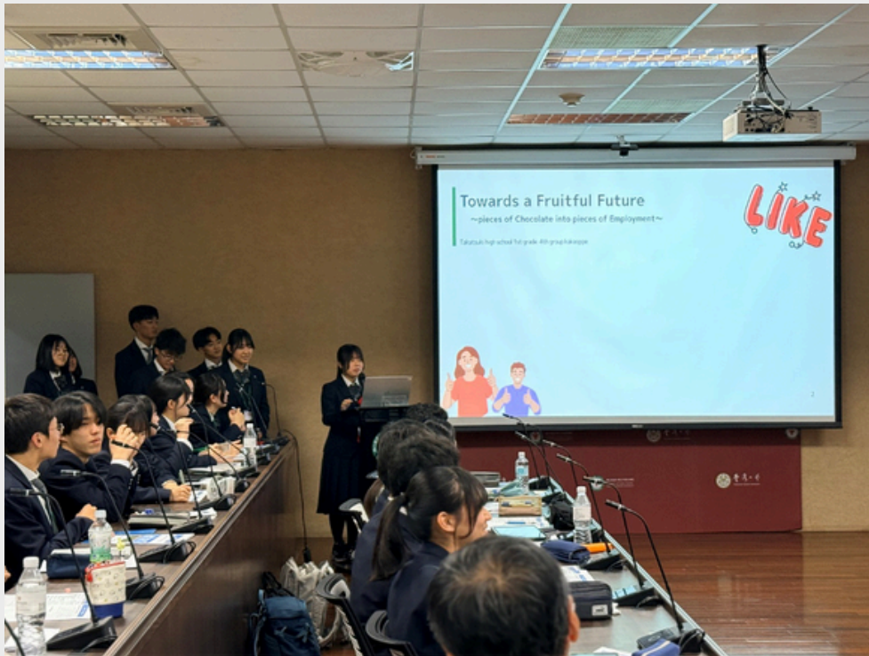
▲ 高槻高中學生第三組專題研究報告「Towards a Fruitful Future ~ Pieces of Chocolate into pieces of Employment~」。