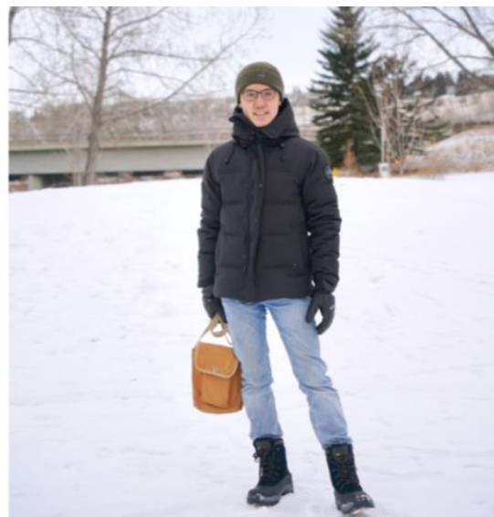
圖：冬季出門標準配備：毛帽大衣手套雪靴

還有一課則是「雪褲」及「雪靴」的重要。如果真的需要走在戶外—例如通勤上班或上學時，原本的褲子鞋子絕對不夠，再加上走在路上很可能不小心踏入厚雪堆中，此時就要套上防水保暖的雪褲以及雪靴，到了公司或學校再脫掉即可（所以公司學校可能要擺一雙室內鞋）。這種雪褲在滑雪或戶外溜冰運動時更能派上用場。另外每次出門，就算只是開車去超市採買或接送小孩，還是要記得戴上全副裝備：毛帽、手套。這倒是比較麻煩的地方，全家大小全部裝備齊全出門常常也得花上一段時間。剛開始有時我們還會忘記，後來就變成冬天出門的反射動作了。