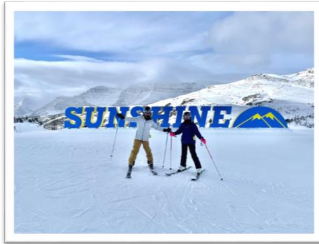
圖：難得的滑雪體驗。

除了溜冰滑雪，冬日還是有許多更親民的娛樂。其中一項當地人最愛的就是「滑雪板/雪橇」Tobogganing。顧名思義，拿一塊類似滑草板的板子，找一塊小山坡，從山頂坐著雪板一路衝下去，就能體驗到直接又暴力的快感了！這是當地人非常普遍的活動，大人小孩都愛，超市都會賣雪板，市政府網站還會列出哪些小山頭是「合法安全」可以滑的，當然為了防護最好還是戴安全帽，此外比較麻煩的是，每次衝下去後，還得自己慢慢爬上山頭—這大概是最累的速率決定步驟了吧！