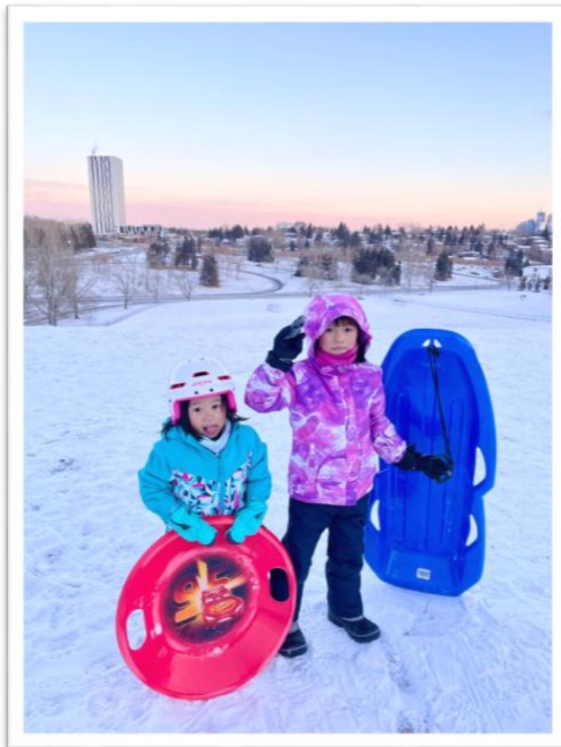
圖：就在我們家後院山坡上可以 tobogganing

除了溜冰滑雪，冬日還是有許多更親民的娛樂。其中一項當地人最愛的就是「滑雪板/雪橇」Tobogganing。顧名思義，拿一塊類似滑草板的板子，找一塊小山坡，從山頂坐著雪板一路衝下去，就能體驗到直接又暴力的快感了！這是當地人非常普遍的活動，大人小孩都愛，超市都會賣雪板，市政府網站還會列出哪些小山頭是「合法安全」可以滑的，當然為了防護最好還是戴安全帽，此外比較麻煩的是，每次衝下去後，還得自己慢慢爬上山頭—這大概是最累的速率決定步驟了吧！