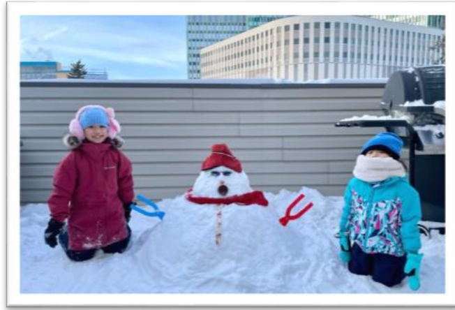
圖：在住家陽台堆雪人。