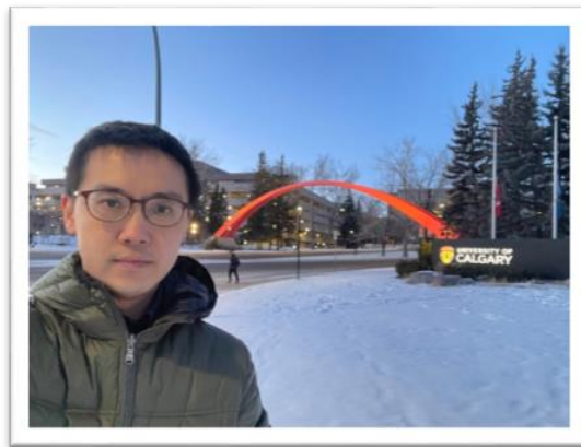
圖：冬日卡加利大學校門

筆者有幸透過醫院獲得教育部因公派員出國計畫，前往加拿大卡加利大學進修。講到加拿大的大城市，台灣人比較熟悉的或許是溫哥華、多倫多、蒙特婁等，而位於亞伯達省 (Alberta) 的卡加利 (Calgary) 可能不那麼熟悉。不過，卡加利其實是加拿大第三大都市，人口多達 120 萬，其中也有人數眾多的華人社群，各種亞洲超市或唐人街商店都一應俱全，因此生活便利性並不亞於其他大城。