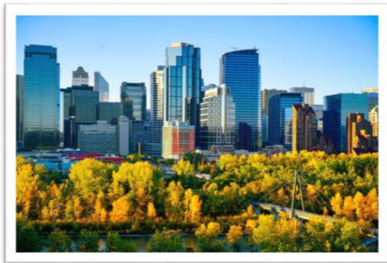
圖：短暫卻絢麗的卡加利金秋

到九月開學開工，但氣候還是很穩定怡人，大約 10-20 度左右，觀光客也少很多。這種”shoulder season”其實是最適合造訪大自然的時期。九月底在洛磯山脈裡更有著名的 larch season（落羽松），整片山頭變成金黃色美不勝收。即使城市裡，也因樹葉變色而有短暫卻絢爛的黃金季節。值得一提的是，亞伯達省位於內陸省，水氣不足，因此雖然加拿大以楓葉聞名，亞省卻幾乎沒有可以賞楓的地方。等到過了黃金季節，就要迎接感恩節。一年四季遞嬗，週而復始，又將進入白雪接管大地的時候了。