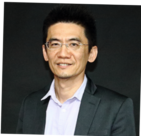
流行病學與預防醫學 研究所所長 林先和教授