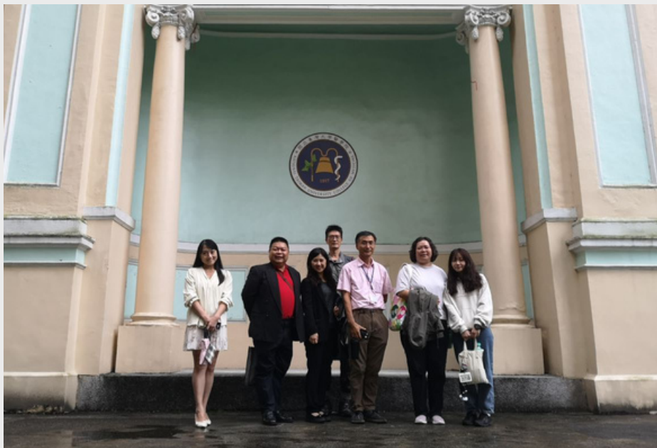
▲ 參與醫學人文博物館的校友合影

除了參與下午場研討會或博物館導覽，與會校友們也抽空參與「臺大公衛校友會第五屆理監事選舉」，在公衛大樓一樓大廳陸續完成投票。傍晚5點至6點於117拱北講堂舉行「臺大公衛校友會第四屆第三次會員大會」，現場開票並選出13位理事和3位監事，期許在新任理監事的帶領下，校友會能日益茁壯，繼續協助學院院務發展，以校友團結力量回饋母校。