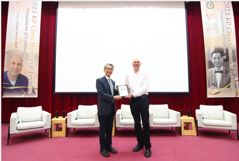
▲ 本院鄭守夏院長與拱北講座獲獎人George Davey Smith教授合影

下午1點半至5點舉行多體學資料分析研討會 (International symposium on analytics and applications of multiomics data in public health)，邀請哈佛大學Steven E. Hyman教授、上午場活動與談人沈柏松教授和松田文彥教授，以及中研院生醫所范盛娟研究員分別帶來精采富於深度的演講。