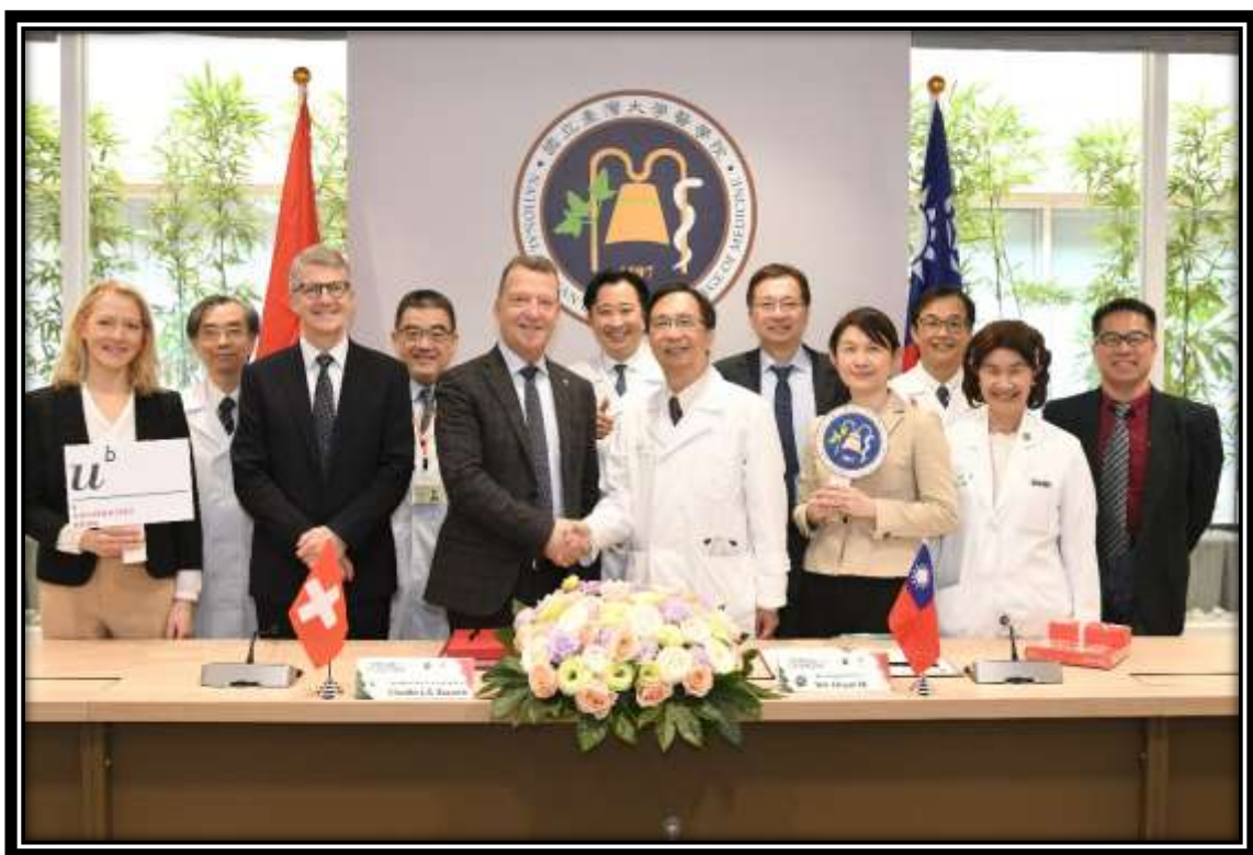
本院與瑞士伯恩大學醫學院簽約儀式

最重要的是，本院正式加入國際睡眠醫學碩士（International Master's in Sleep Medicine）聯盟，與瑞士伯恩大學以及其他 13 所國際優秀大學合作，培育新一代的睡眠科學家和臨床醫生。台灣也成為亞洲人才的培育據點，這不僅實現了本次論壇的初衷，也提高了台灣醫藥公共衛生領域的國際知名度。