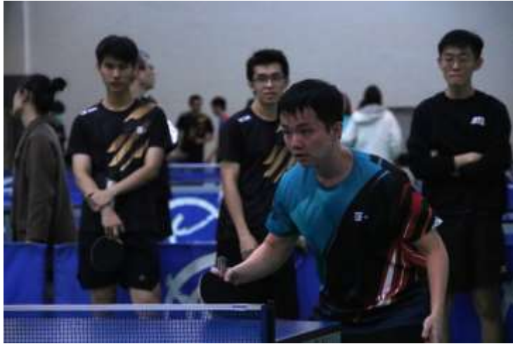
圖二、球員十分專注於比賽，觀眾也目不轉睛地欣賞著。