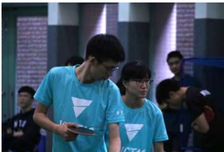
圖四、雙打比賽需要與隊友培養絕佳默契。