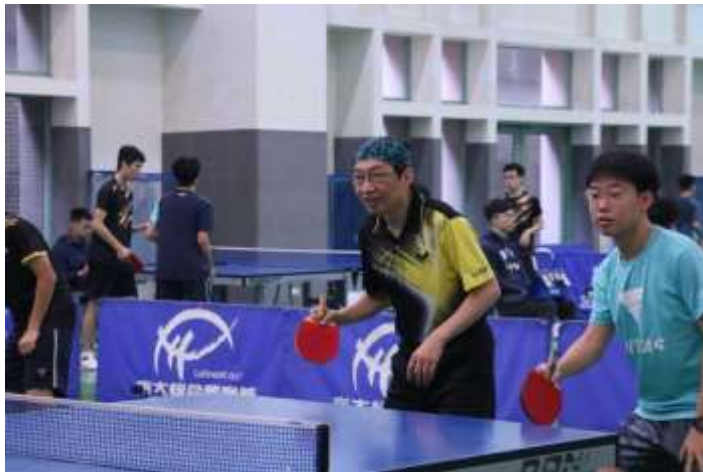
圖一、教授與同學一起組隊參加歡樂雙打，機會難得。

頒獎時，得獎的各隊都洋溢著笑容，未獲獎的各隊也都在一旁鼓掌歡呼，運動家的精神在這次的鎮源楓城盃中展現的淋漓盡致，這是一場屬於臺大桌球愛好者的賽事，也是大家能齊聚一堂切磋球藝、認識志同道合球友的年度盛事！