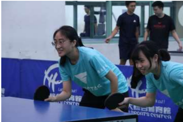
圖三、比賽時雖然緊張，但有隊友的支持與陪伴能更有信心！